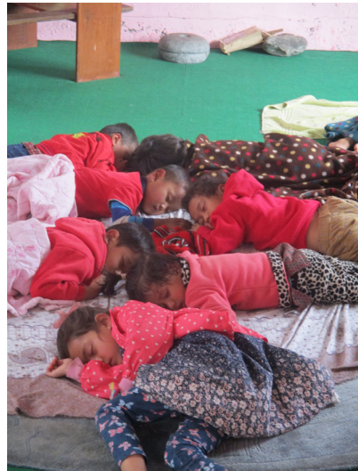
Uitrusten na hard werken, Nepal

De doorbraak in de ontwikkeling van Waldorf-scholen in Vietnam, die in 2015 plaatsvond, lijkt zich verder te bestendigen.