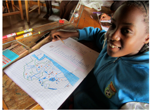
Rudolf Steiner School Mbagathi, Kenia

bijbscholing van leerkrachten, die zich vaak over een periode van meerdere jaren uitstrekt. Zo wordt de continuïteit van het project gewaarborgd, waardoor veel kinderen de kans krijgen zich in hun schooljaren vrij te ontwikkelen. Wij willen iedereen die bijgedragen heeft aan ons werk daarvoor hartelijk danken!