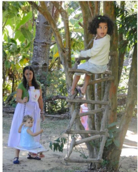
Buiten spelen, vrijeschool Alecrim, Brazilië