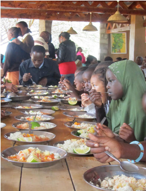
Elke dag een voedzame maaltijd op Rudolf Steinerschool Mbagathi Kenia.

Inkanyezie kreeg een geldelijke bijdrage die het mogelijk maakte dat sommige essentiële vakken voortgezet konden worden.