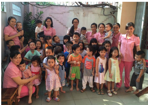
Vrijkleuterschool Tre Xanh, Vietnam