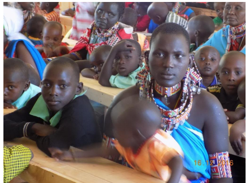
Opening van het nieuwe gebouw Naretoi school (Masaai) in Selenkay, Kenia