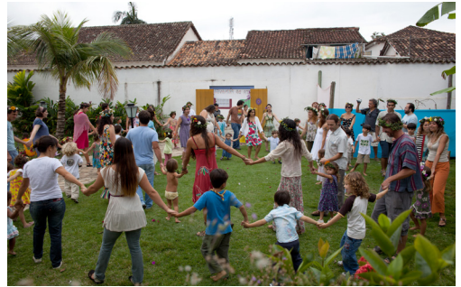
St.Jansfeest Vrijeschool Quintal Magico Brazilië

Twee Nederlandse leerkrachten zijn naar Portugal gegaan om leraren te begeleiden en om een zomercursus te geven, het IHF droeg bij aan de reiskosten van deze vrijwilligers.