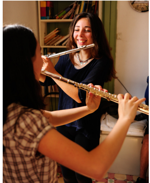
Muziekles op vrijeschool Tretzevents, Spanje

Het IHF stelt aan de scholen de voorwaarde dat de portefeuillehouder jaarlijks op de hoogte gehouden wordt van de vorderingen van de betreffende leerling(en). Deze informatie over de kinderen en de school wordt doorgestuurd naar de betrokken donateurs.