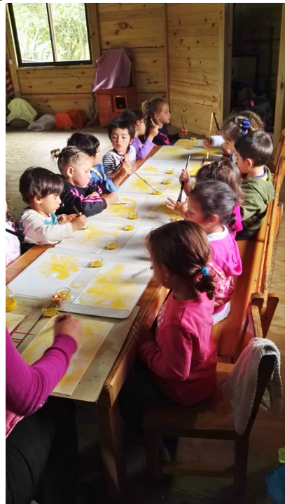
Vrijeschool Costa Rica

De banden met diverse vrijescholen in Nederland werden aangehaald via bijvoorbeeld de WOW steunactie (Waldorf One World). De inzet van sociale media zoals Facebook om direct contact te onderhouden met geïnteresseerden loopt nog achter bij de verwachtingen. Hanna van Bentum liep stage bij het IHF en onderzocht wat er nog meer aan publiciteit gedaan kan worden.