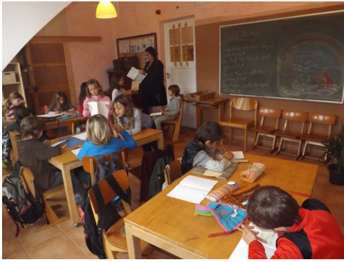
Stoelen uit Nederland krijgen nieuw leven in Portugal