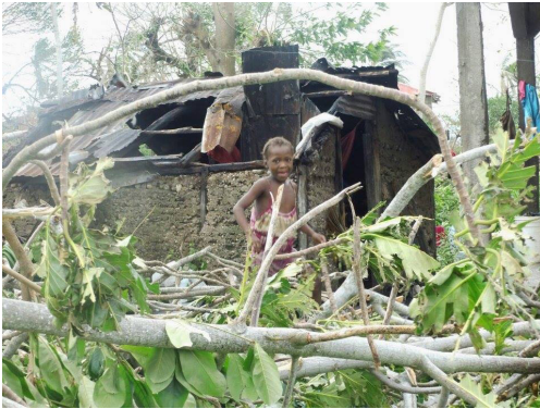
Vrijeschool Haiti, na de orkaan

Verder wordt het IHF door Nederlandse tussenpersonen op de hoogte gehouden van de initiatieven in de Kaukasus, Midden Europa en de Oekraïne.