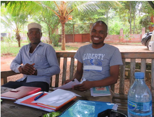
Leraren van CEFschool Zanzibar bereiden hun lessen voor