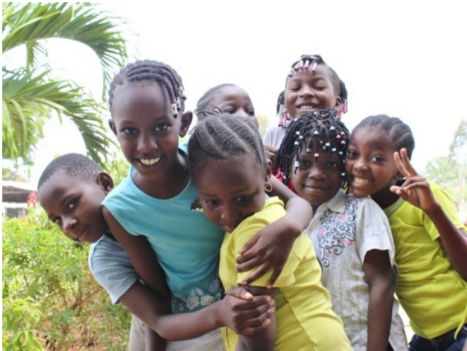
Hekima Waldorf School, Tanzania