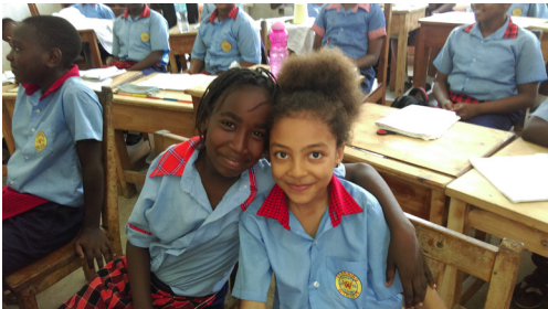
Hekima school Dar es Salaam, Tanzania

Er is een grote bestelling aan popjes door Pampatoys Argentinië geleverd, voldoende voor de komende drie jaar. De verkoop via de webwinkel verloopt goed. Met name de sloffen uit Peru zijn populair, de maten 37 t/m 44 zijn uitverkocht.