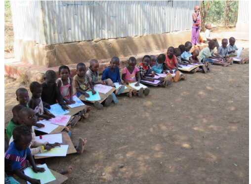
Kakuma vluchtelingen project

De Naretoi Masaai School in Selenkay kreeg dankzij steun van het IHF een stenen gebouw. De school telt nu 60 leerlingen.