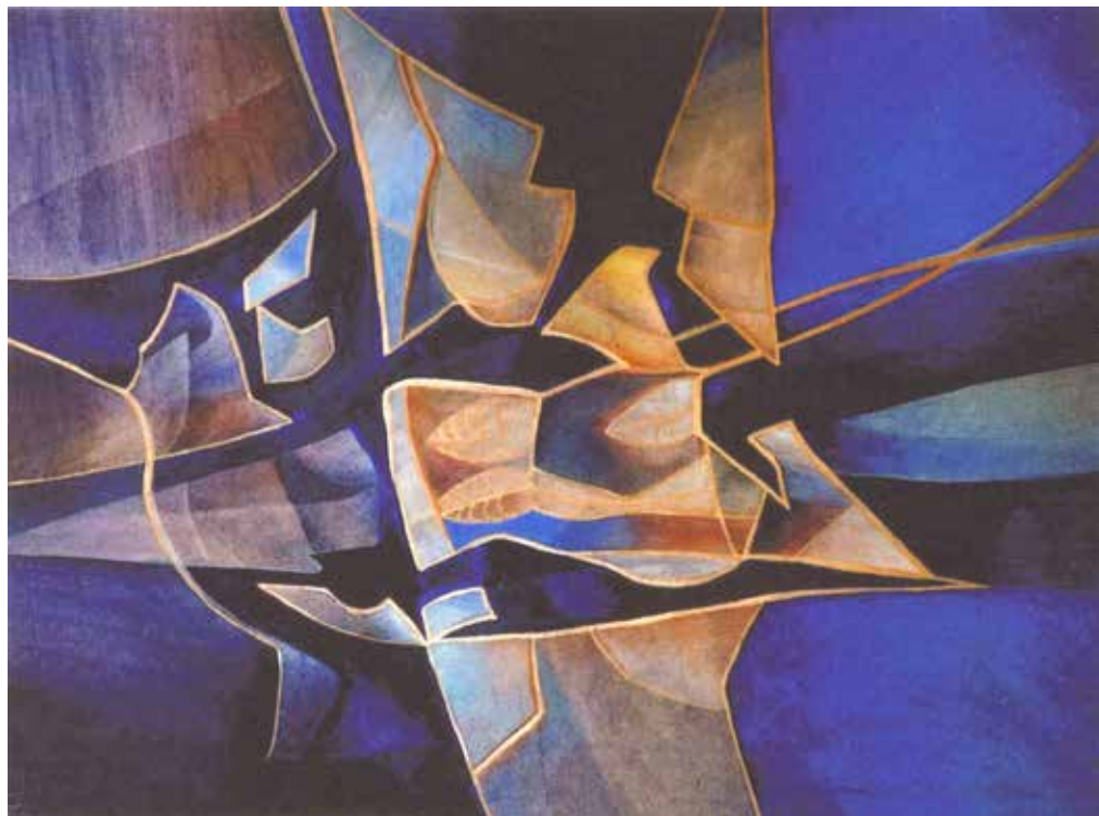
Schilderij van Mieke Fielmich