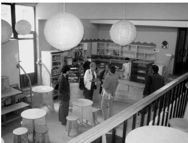
De nieuwe mensa in Jerevan

Armenië dat na het uiteenvallen van de Sovjetunie een klein, geïsoleerd land is, besloeg ooit een gebied bijna tien maal zo groot. Hoewel er sinds een aantal jaren een wapenstilstand is, is het land toch nog in staat van oorlog met Azerbeidzjan. Ook met Turkije heeft Armenië slechte betrekkingen, wat niet verwonderlijk is na de genocide van bijna een eeuw geleden. Er zijn maar vier grensovergangen: drie naar Georgië en één naar Iran. De berg Ararat, hét symbool van Armenië, ligt vlak over de grens in Turkije.