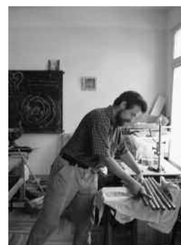
Zorg voor de instrumenten