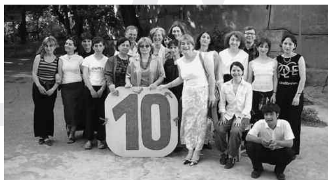
Toen de Michaelschool in Tbilisi 10 jaar bestond

Financieel heeft de school het natuurlijk niet gemakkelijk. De kosten zijn hoog, de salarissen laag. De ouders worden nu een bijdrage gevraagd. Tbilisi is een grote stad en transport is voor velen een probleem. Een aantal ouders heeft een busje georganiseerd om hun kinderen naar school te brengen en op te halen, maar ook dit kost natuurlijk veel. Een kaartje voor de metro - die vrij dicht bij de school komt - is twee keer zo duur geworden. Hoewel het voor onze begrippen bijna niets kost (ongeveer 15 eurocent), is het voor de meeste mensen hier veel geld; Georgië is nog steeds een arm land.