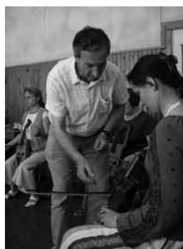
Let op de vingerzetting