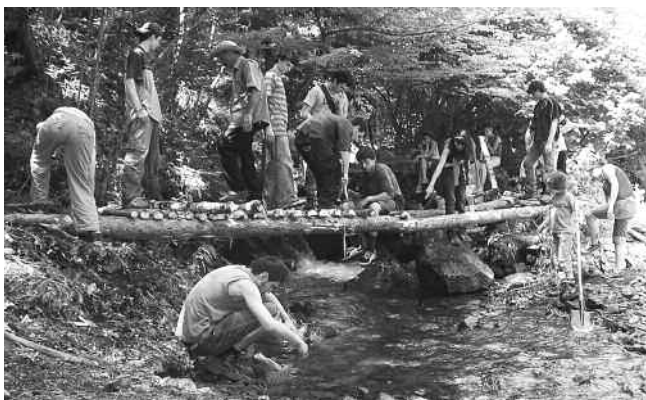
Biologie excursie in Georgië