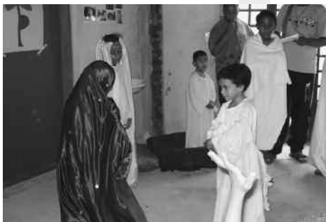
Kerst in de kindergroep

Het project Guainumbi, voor mensen met een verstandelijke beperking, ligt midden in de wijk 'Jardim Angela' die volgens de statistieken tot de tien sociaal zwakste van São Paulo behoort. Van de 145.000 bewoners leeft 73% onder de absolute armoedegrens. Door deze overbevolkte en verpauperde krottenwijken waar de meest basale voorzieningen zoals water en elektriciteit ontbreken, wordt ernstige schade aan het milieu toegebracht vanwege illegale stortplaatsen, lozingen, open riolen en houtkap. De nijpende armoede, het ontbreken van werkgelegenheid en van mogelijkheden voor vrijetijdsbesteding, veroorzaken een geweldsspiraal en een hand over hand toenemende drugshandel en criminaliteit. Deze problemen schreeuwen om een oplossing en het is dringend noodzakelijk dat de leefomstandigheden in de wijk verbeteren. Guainumbi probeert bij de bevolking daarvoor bewustzijn te kweken en samen iets te ondernemen, de misstanden aan te pakken en bewoners te stimuleren het leven in eigen hand te nemen. De enige faciliteiten in de wijk zijn een handvol scholen, een politiepost en twee buslijnen. Omdat andere voorzieningen ontbreken, zijn de bewoners voor hun werk, een arts of dagelijkse boodschappen, aangewezen op andere stadsdelen die zij alleen maar via een enkele gammele brug kunnen bereiken.