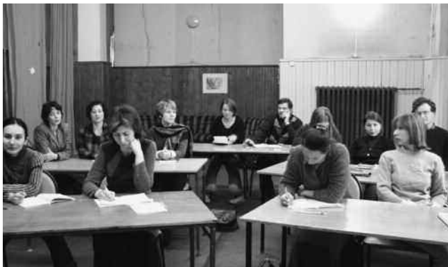
Cursus in dagcentrum Toermalijn

De belangrijkste plek in een Russische woning is de keuken. Daar wordt niet alleen gekookt en gegeten, maar ook gepraat, uren achtereen. Als je als buitenlander het geluk hebt het leven in zo'n keuken mee te maken, heb je echt iets van Rusland gezien. Wat voor moment van de dag het ook is, het is altijd etenstijd. Het bezoek wordt naar de keuken geloodst en aan de tafel gezet waarop steeds nieuwe gerechten verschijnen. Voor je het weet zijn er uren verstreken. Na afloop is niet alleen de maag gevuld, ook de ziel is verwarmd. Tijdens het eten begint het gesprek dat al gauw overgaat in allerlei filosofische bespiegelingen. Met hart en ziel zijn Russen in gesprek en niet zelden loopt de toon van het gesprek hoog op. Later komt de gitaar tevoorschijn en wordt er gezongen.