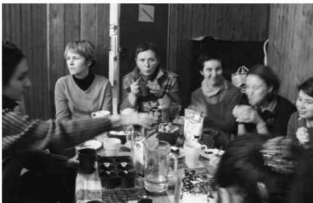
Rond de keukentafel

De afgelopen 15 jaar is de sociaaltherapeutische en heilpedagogische beweging verder gegroeid en in 2004 werd de hele beweging in een vereniging samengebracht. Het vinden van gekwalifi-