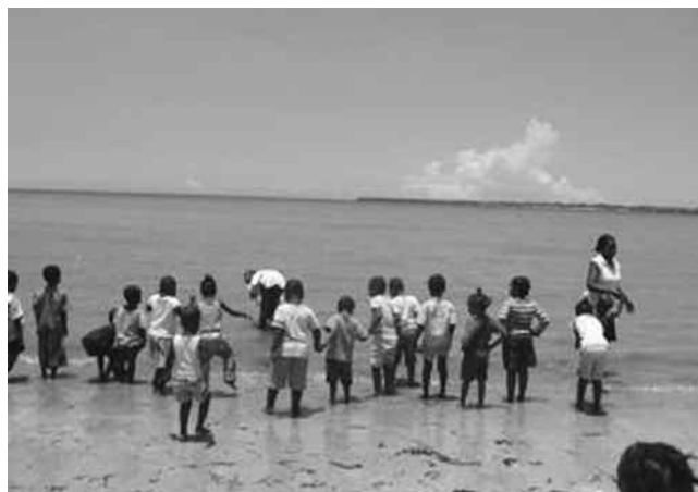
Vele pootjes baden pootje in de zee

school. De 28 andere weeskinderen wonen bij een oma of tante, vaak in omstandigheden die wij ons in het rijke westen niet kunnen voorstellen. Ik ben een dag meegegaan naar de wijken waar deze kinderen vandaan komen. Via de wijkbestuurders krijgt de school aanvragen. Samen met een ambtenaar zoekt een van de leerkrachten de kinderen op om te kijken of ze in aanmerking komen voor een schoolsponsorschap.