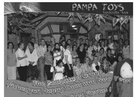
Feest bij Pampatoys