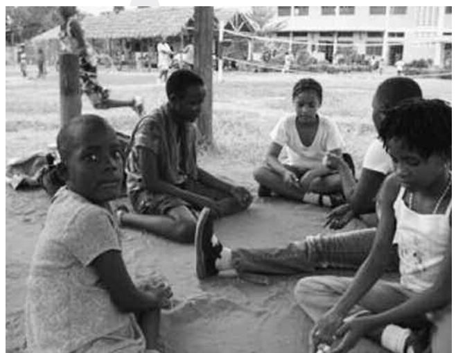
De APJL club vergadert