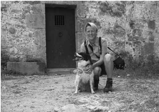
Zinnvolle tijdsbesteding in de Spaanse Pyreneeën

Ook langs de lijn van het sportveld weet men je te vinden. Je kunt altijd wel iets doen bij de sportclub van je kinderen. Heel wat jaren loop je mee om de kinderen aan te moedigen, rijd je op zaterdag naar weer een andere wedstrijd, sta je achter de bar, help je bij evenementen. Voor je het weet ben je onmisbaar voor de club en is het hele weekend bezet.