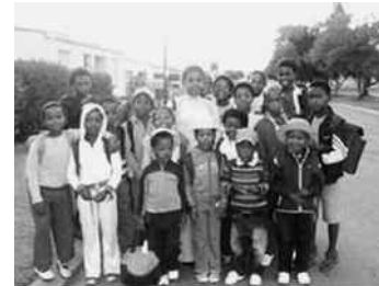
Allemaal met de bus

Uw bijdragen zijn heel welkom o.v.v. code 9212, Bus Fund