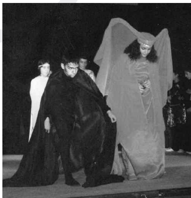
Toneel op de Aregnazan Waldorf-School