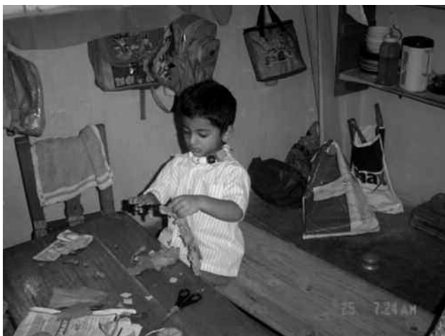
Stilletjes in de knutselhoek

Abhaya is ontstaan vanuit onvrede en verontwaardiging. Hoe heerlijk cholericus en eerlijk is eerlijk, zo kwam het leerkrachten-team ook op mij over. Stevige, doortastende dames met een uitgesproken mening die weten wat ze vinden, weten wat ze willen en het vervolgens gaan doen. Zo waren ook de lessen die ik bijwoonde vol energie en vitaliteit. Abhaya is gevestigd in een authentiek en romantisch complex van kleine gebouwtjes rondom een grote, door prachtige bomen beschaduwde binnenplaats. Abhaya neemt geen zorgkinderen aan en van de 95 leerlingen zijn er zeven die de halve ouderbijdrage betalen of helemaal geen. Het IHF sponsort vier van deze kinderen.