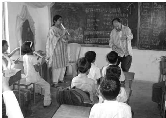
Noten tot muziek gefloten

Diksha is een vitale school met 120 leerlingen die voornamelijk tot de hindoe bevolking behoren. 10% van de kinderen betaalt geen schoolgeld. Vijf van deze kinderen worden gesponsord door buitenlandse organisaties en de rest door rijke Indiërs. Er is een duidelijk beleid t.a.v. zorgkinderen; er zijn er vijf in de onderbouw en vier in de kleuterklas. Diksha zou ik sanguinisch noemen.