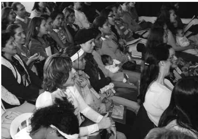
Grote zaal op de open dag